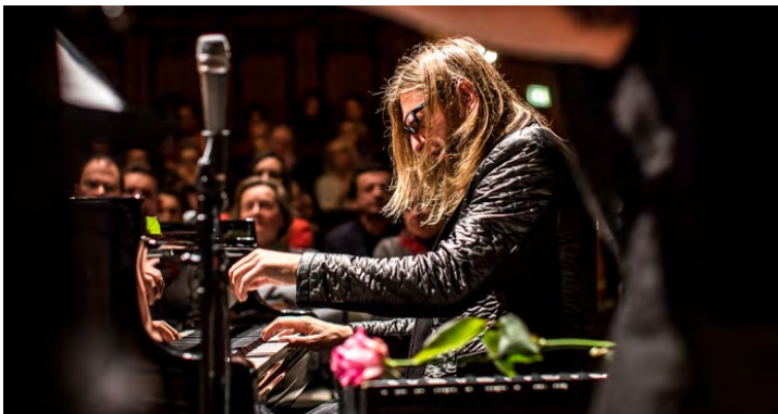
Leszek Możdżer et Holand Baroque

(orchestre sur instruments anciens). Ce concert marquera un nouveau partenariat avec le théâtre Paul Éluard de Bezons.