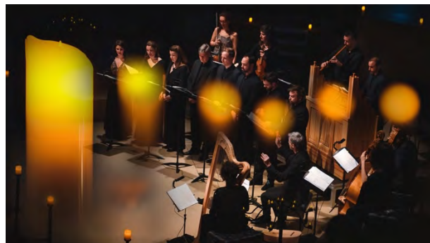
Le Poème Harmonique