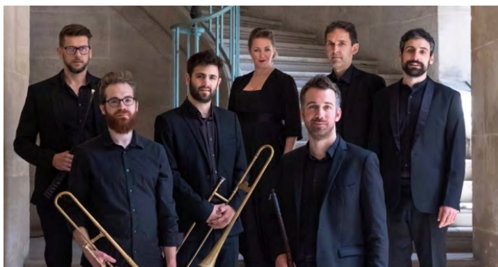
La Guilde des Mercenaires

Hugo Reyne et les élèves du Conservatoire de Paris illustreront musicalement les batailles et les bruits de guerre. Nous explorerons « La Légende noire », le parcours criminel et musical de Gesualdo par La Guilde des Mercenaires.