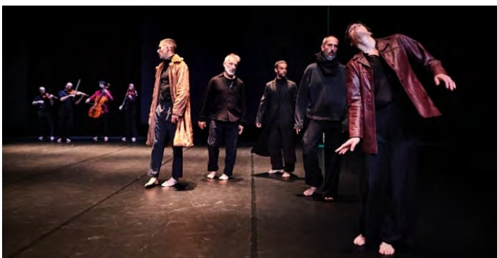
Cie Mal Pelo

Pour rester avec J.S. Bach, nous programmerons avec Points Communs le nouveau spectacle de Mal Pelo (exceptionnel ensemble de danse contemporaine) « Highlands » sur la musique de Bach, jouée par le plus grand spécialiste espagnol du violon baroque d'aujourd'hui : Joël Bardolet. Nous aurons l'honneur de les accueillir juste après la création au Théâtre de la Ville.