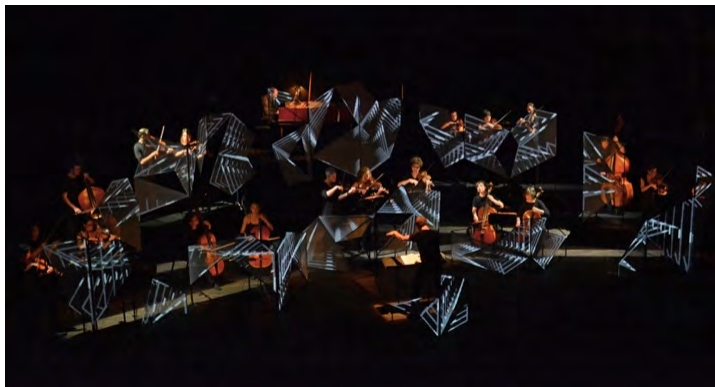
La Tempête