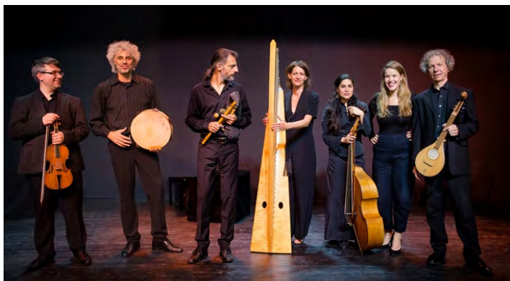
Les Musiciens de St-Julien

« The Queen's Delight » par Les Musiciens de Saint-Julien rétablira la vérité sur les racines populaires de la musique baroque britannique.